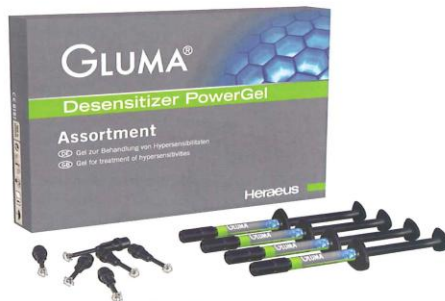
GLUMA® Desensitizer PowerGel-Sortiment

GLUMA® Desensitizer hat sich seit mehr als 15 Jahren bei der Behandlung postoperativer Sensibilitäten im Markt etabliert. Seitdem wurde das Heraeus-Produkt bei über 50 Millionen Restaurationen weltweit eingesetzt. GLUMA® wurde bis heute als einziger Desensitizer auf dem Markt mit dem „Five Star Award“ vom US-Testinstitut REALITY prämiert. Er wurde zudem mehrfach von „The Dental Advisor“ ausgezeichnet, erhielt seit 2002 jährlich den „Townie Choice Award“ und 2009 so-