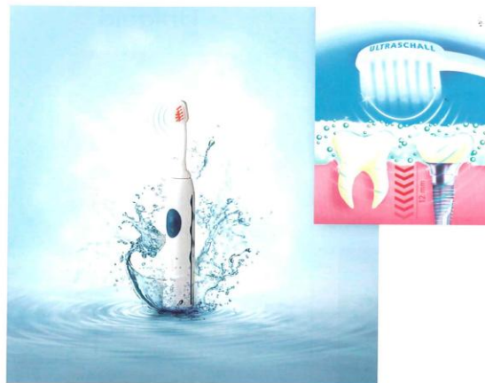
Emmi-dental Professional plus Ultraschall-Zahncreme: das Dream Team für die Zahreinigung und Mundhygiene

... reinigt ausschließlich durch Ultraschallschwingungen, nicht nur die Zähne, sondern auch Zahnzwischenräume, Fissuren und Zahnfleischtaschen. 96 Millionen Luftschwingungen pro Minute, mit sehr geringer Leistung von 0,2 Watt, mit sehr hoher Frequenz und ganz ohne zu bürsten! Auf den ersten Blick sieht sie aus wie eine „normale elektrische Zahnbürste“, aber sie wirkt völlig anders. Sie wird lediglich an die Zähne gehalten. Kein Bürsten, kein Schrubben, kein zu starker Druck! Durch den weichen Strahl des Ultraschalls entstehen durch die milde, frische Spezialzahncreme des Unternehmens, die wahlweise keinen oder nur einen sehr geringen Fluoridgehalt von 0,1 Prozent hat, Mikrobläschen. Sie entfernen sehr schonend Zahnstein, Verfärbungen durch Tee, Kaffee, Rotwein, Nikotin. Mund ausspülen und zurück bleiben strahlende gesunde Zähne und ein gut durchblutetes Zahnfleisch. Der Mundraum ist antibakteriell gereinigt. //